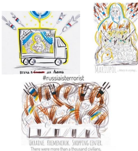
Рис. 12. Скегчі Уляни Креховець

торгівельного центру у м. Кременчук. Під час теракту в «Амсторі» знаходилося біля 1000 осіб, кілька десятків людей загинуло 36 .