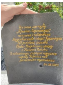
Рис. 2. Христос-воїн, ікона на пластині бронезилета для Кременчуцького військового музею

Наразі важливою є арт-терапевтична функція сакрального мистецтва. Приміром, Український католицький університет зміг допомогти великій кількості вимушених переселенців проводячи на базі Іконописної школи «Радуж» #іконописниймарафонуку – майстер-класи з іконопису. Створення традиційної ікони на склі давало можливість дітям та дорослим швидше адаптуватись до жорстокої реальності. Це була своєрідна молитву пензлем, як спосіб терапії 22 . В стінах Полтавської місіонерської духовної семінарії організовано постійно діючу експозицію творів сакрального живопису (рис. 3), яку можуть відвідати всі бажаючі, для яких проводяться групові та індивідуальні екскурсії. В перший рік війни ПМДС прийняла в своїх стінах близько півтори сотні вимушених переселенців, для яких галерея сакральних творів в інтер'єрі навчального закладу слугувала засобом арт-терапії.