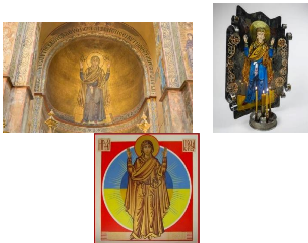
Рис. 6. «Нерушима Стіна» Софії Київської, ікони проекту «Art of war» та художника Івана Доброписця

Так, митці проекту «Art of war» створили образ Оранти на гільзі від снаряду; художник-іконописець Іван Доброписець зобразив Оранту на тлі українського Сонця, яке може бути алюзією на відоме пророцтво першого президента Ічкерії Джохара Дудаєва про занепад Росії, після того як зійде українське сонце (рис. 6).