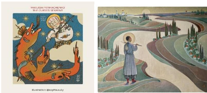
Рис. 5. Ілюстрація Софії Сулій та картина Миколи Анісімова «Україна у пошуках казкового міста Сонця»

Проф. Богдана Крися наголошує, що творчість Григорія Сковороди балансує на межі між вимовністю та невимовністю, ловитвою та невловимістю. Мова його творів спрямована на відновлення зв'язку між Богом та людиною, це – вершина метафізичного виміру українського тексту. «Сковородинські діалоги стали тими непростими дорогами, на яких у товаристві співрозмовників кожному відкривається можливість зрозуміти й пізнати Божественну сутність своєї душі як основу благословенного життя. Це і є той «обхідний шлях через темну й невимовну апофеозу хори», що «має на меті енергійну катафазу осяяних Ідей»» 27 .