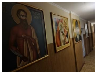
Рис. 3. Постійна експозиція в Полтавській місіонерській духовній семінарії