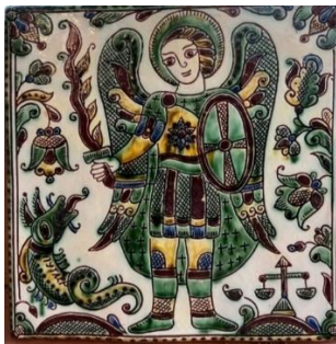
Рис. 7. Архангел Михаїл, косівська кераміка

міжнародної спадщини ЮНЕСКО, створила керамічну ікону архангела Михаїла, який протистоїть змію з написом на спині «путлер» (рис. 7). Митцями Іконописної школи Полтавської семінарії наразі також створюються ікони небесних покровителів як окремих захисників Вітчизни, так і цілих міст.