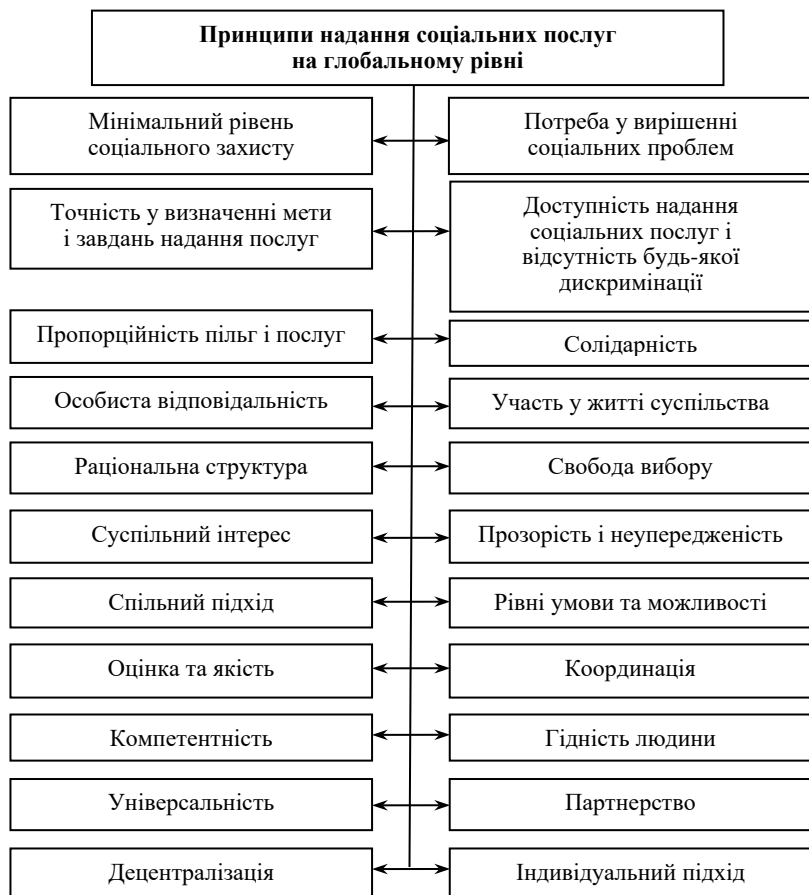
Рис. 1. Принципи надання соціальних послуг на глобальному рівні