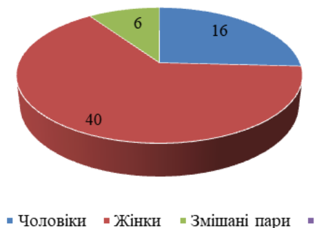
Рис. 2. Гендерний розподіл завойованих китайськими спортсменами олімпійських медалей на зимових Іграх 1980–2014 років

Широке представництво жінок у олімпійській збірній команді КНР свідчить про більш успішний та ефективний розвиток жіночого зимового олімпійського спорту порівняно з чоловічим, хоча в даний час ця тенденція поступово вирівнюється. Заходи, які були прийняті урядом, стали основою для розвитку зимових видів спорту і вплинули на результати виступів китайських спортсменів на Олімпійських зимових іграх. Є помітні успіхи у розвитку шорт-треку, спостерігається стабільна позитивна динаміка у розвитку фрістайлу, ковзанярського спорту, фігурного катання, керлінгу і сноуборду. У КНР створено базу для розвитку інших видів зимового спорту, в яких наразі залишається відставання від світових лідерів олімпійського зимового спорту.