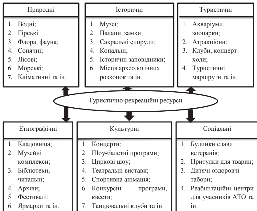
Рис. 4. Туристично-рекреаційні ресурси санаторно-курортних комплексів

Туристичні ресурси соціального спрямування до яких відносимо: будинки слави ветеранів; притулки для тварин; дитячі оздоровчі табори; реабілітаційні центри для учасників АТО мають двохсторонню цінність. По-перше приваблюють велику кількість відпочиваючих з профілактичною метою, та дозволяють провести повноцінний відпочинок усім членам сім'ї. А по-друге сприяють соціальному захисту населення. Розміщення перелічених вище організацій є раціональним лише у масштабних санаторно-курортних комплексах державного значення.