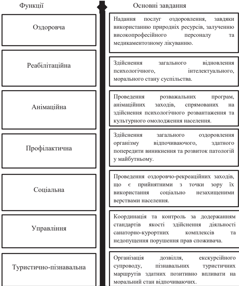
Рис. 3. Функції та основні завдання діяльності санаторно-курортних комплексів

Основною метою функціонування санаторно-курортних закладів є забезпечення можливості використання природних ресурсів під час процесу морального та фізичного оздоровлення населення із подальшим одержанням позитивних соціально-економічних результатів від проведення підприємницької діяльності.