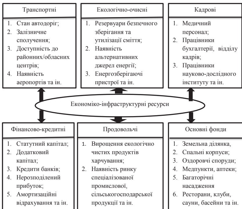
Рис. 5. Економіко-інфраструктурні ресурси санаторно-курортних комплексів