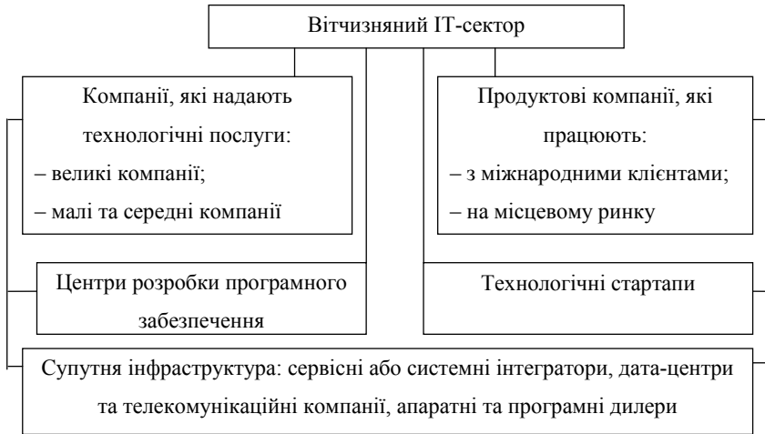
Рис. 1. Структура ІТ-сектора в Україні