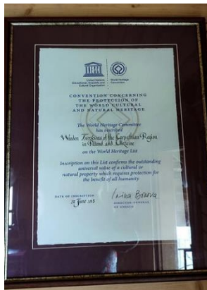
Фото. Документ засвідчує, що церква перебуває під захистом ЮНЕСКО з 2013 року 42

Струківська церква зовсім невелика, але вона є найбільш шанованою православною та греко-католицькою (обидві церкви проводять тут богослужіння по черзі) церквою в Ясіня 43 . Сьогодні, разом із церквою в Ужку, вона є одним із двох представників Закарпаття, внесених до Списку всесвітньої спадщини ЮНЕСКО. Щоб потрапити до неї,