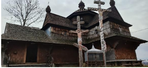
Фото. Струківська церква 1824 р.