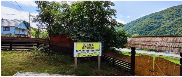
Фото. На території церкви табличка, яка свідчить про «Велику реставрацію»