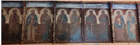
Фото. Фрагмент іконостасу

У 1818 році Михайлівську церкву було перенесено і перебудовано в стилі закарпатської готики. Від збудованого у XVIII столітті храму збереглися зруби стін і каркас нижньої частини башти. У 1887 році поруч із храмом збудували дзвіницю 38 .