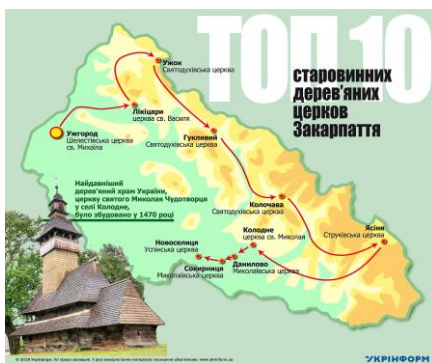
Фото. ТОП-10 дерев'яних церков Закарпаття

Перед вами карта дерев'яних церков Закарпаття, пропонує здійснити віртуальну паломницьку мандрівку маршрутами архітектурної спадщини Закарпаття і частково розглянути значущість цих об'єктів для атракції туристів і паломників у соціальнокомунікаційній площині 11 і з метою фіксації цих сакральних об'єктів для збереження культурної спадщини. Закарпаття з точки зору туристичного магніту є цінним регіоном, тому збереження сакральної спадщини має державне та міжнародне значення.