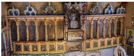
Фото. Фрагмент іконостасу з дерев'яної церкви Святого Архангела Михаїла 1745 рік. Село Ужок

https://www.facebook.com/photo/?fbid=2906426412726128&set=a.2906419949393441&locale=uk_UA ]