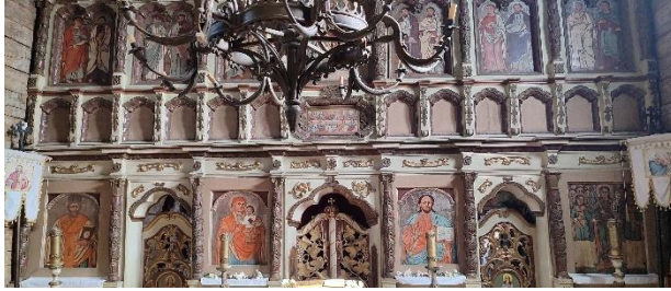
Фото. Сучасний іконостас Шелестівської церкви в Ужгородському скансені 29

Інші яруси іконостасу заповнені іконами XVIII століття, що походять із церкви села Колочава 30 . Раніше іконостас Шелестівської церкви прикрашали ікони видатного закарпатського живописця XVII сторіччя Іллі Бродлаковича-Вишенського 31 . Яскравий представник українського бароко народився та працював у Судовій Вишні, що на Львівщині. Потім переїхав у Мукачево. Підписувався: «Ілля Бродлакович Малярь Вишенский, Малярь Мукачівский». Ікони його пензля – «Архангел Михаїл», «Святий Миколай», «Богоматір Одігітрія» – зберігають у Закарпатському обласному художньому музеї ім. Йосипа Бокшая. Більшість оригінальних ікон Шелестівської церкви зникли 32 .