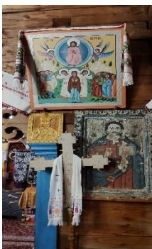
Фото. Ікона Господа Спасителя XIX століття, не відреставрована.