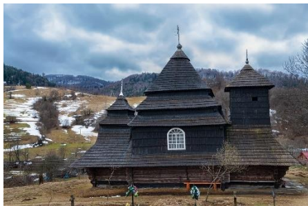
Фото. Дерев'яна церква Святого Архангела Михаїла.

Дерев'яна церква Святого Архангела Михаїла, село Ужок 1745 року