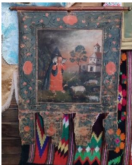
Фото. На хоругві початку XX століття зображено Струка з ягням 45 .

У церкві серед сакральних об'єктів протягом тривалого часу зберігалося церковне знамено XIX століття, на якому був зображений угорський король Святий Іштван та напис « S. Stephan I Rex Ungar ». Але влітку 2008 р. невідомі особи під вночі розбили вікно, виламали ґрати і, вдершись до храму, поцупили старовинну святиню 44 .