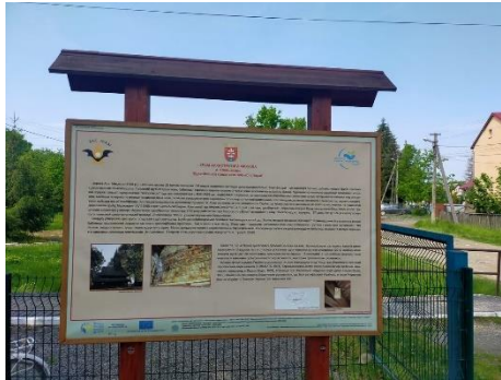
Фото. Пам'ятка знаходиться під охороною держави

Побудова плану церкви – архаїчна. Церква побудована з високих дубових брусів, з'єднаних врубками в канюк з потайним прямим зубом. В архітектурі цієї церкви з'являється новий конструктивний прийом, відсутній в старіших церквах і який нечасто зустрічається і далі – ганок-галерея зв'язана у західній стіні в один загальний зруб бабинця і нави. Бабинець – західна частина тридільного храму, протилежна апсиді. Назва походить від українського слова «баба» – у церкві в бабинці стоять жінки та оглашенні. Бабинець входить у канонічну, тридільну систему планування православного, переважно дерев'яного храму – бабинець, нава, вівтар. Нава, також неф – поздовжня або поперечна частина простору монументальної споруди, що розташована між рядами колон, стовпів, арок або між зовнішньою стіною та поздовжньою колонадою або аркадою. Цей прийом запозичений з житлово-господарського