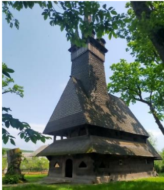
Фото. Дерев’яна дзвіниця розташована на території храму 19