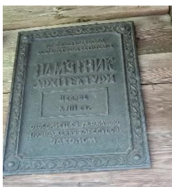
Фото. Табличка свідчить, що це пам'ятка архітектури національного значення (№ 219)

Сучасну церкву святого Архангела Михаїла збудували із смереки в XVIII сторіччі в урочищі Потік у бойківському стилі, з трьома верхами. Але існує декілька версій, згідно яких церкву було споруджено в присілку Ясеновець, що був зруйнований через величезний зсув гори. Згідно з написом на зрубі, у червні 1818 року завершили встановлення церкви на новому місці, де вона отримала двосхилі дахи і вежу. Біля церкви стоїть типова для міжгірської Верховини дерев'яна двоярусна каркасна дзвіниця 37 .