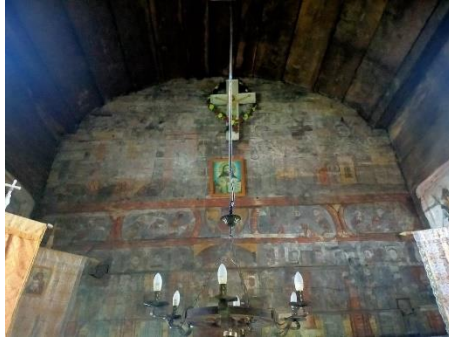
Фото. Старовинний іконостас на полотні (невідреставрований)