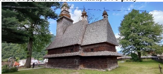
Фото. Церква Святого Духа – це унікальна пам'ятка дерев'яної сакральної архітектури 1795 року, яка досить добре збереглася

Церква повністю побудована без цвяхів, привертає увагу та викликає захоплення своїми досконалими пропорціями. Храм біля головної дороги у селі Колочава. За радянських часів церква використовувалась як музей атеїзму. На жаль, інтер'єри її не збереглися, натомість зовнішній вигляд храму й сьогодні захоплює відвідувачів своєю красою. Пам'ятка повністю відреставрована у 1969–1970 рр. Церкву зняли із реєстрації діючих храмів 9 січня 1953 р.