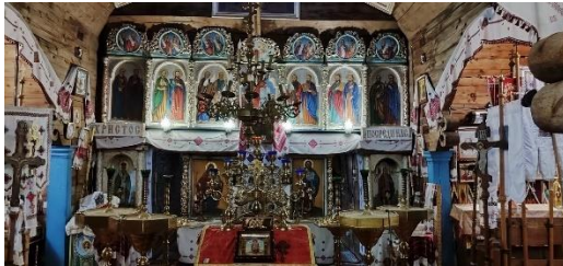
Фото. Старовинний іконостас, справжній витвір сакрального мистецтва.