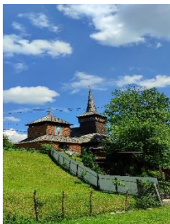
Фото. Церква Святого Михайла в селі Негровець єдиний екземпляр бойківської архітектури, що зберігся в первісному вигляді

Сучасну церкву святого Архангела Михаїла збудували із смереки в XVIII сторіччі в урочищі Потік у бойківському стилі, з трьома верхами. Але існує декілька версій, згідно яких церкву було споруджено в присілку Ясеновець, що був зруйнований через величезний зсув гори. Згідно з написом на зрубі, у червні 1818 року завершили встановлення церкви на новому місці, де вона отримала двосхилі дахи і вежу. Біля церкви стоїть типова для міжгірської Верховини дерев'яна двоярусна каркасна дзвіниця 37 .