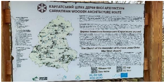
Фото. Інформаційна дошка про Струківську церкву із QR-кодом та сучасними digital-можливостями