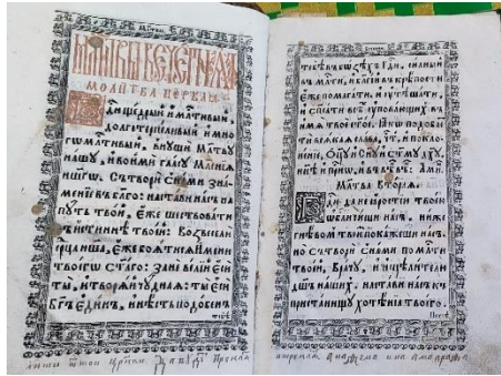
Фото. Стародруки із Свято-Михайлівського храму