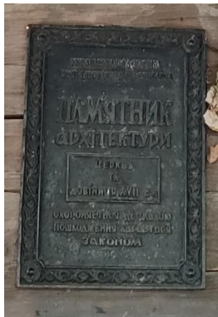
Фото. Табличка свідчить, що це пам'ятка архітектури національного значення (№ 216).

Свято-Михайлівський храм – це дерев'яна церква, яка розташовується у селі Негровець, Міжгірського району, Закарпатської області. Один із найкращих зразків дерев'яних церков із баштами. Перед бабинцем є доволі глибокий ганок із відкритою аркадою-обходом над ним, а перехід від гранчастої башти до шпилья зроблений за допомогою невисокої чотиригранної пірамідальної покрівлі. Нижній масив слабо розчленований опасанням, що обходить навколо храму, зливаючись з покрівлею апсиди. Пропорції досить широкого в основі шпилья добре поєднуються із баштою. У храмі можна побачити старовинний іконостас та ікони, які збереглися до сьогоднішнього дня. Інтер'єр церкви