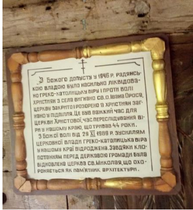
Фото таблички на церкві в с. Сокирниця.

Святомиколаївський храм розташований у селі Сокирниця Хустського району відноситься до архітектурних шедеврів Закарпаття, перша згадка датується 1704 роком. Церква Святого Миколи Чудотворця є найстарішою на території Закарпаття. Храм побудований із дерева особливим архітектурним стилем повністю без застосування цвяхів. Храм оточений 600-літніми і 400-літніми дубами. За переказами спочатку ця церква була побудована у селі Шашвар (сьогодні це село Тросник у Виноградівському районі на початку XVII століття), а потім її перенесли у село Сокирниця. До наших днів зберігся старовинний іконостас, датований 1748 роком. Церква Святого Миколи Чудотворця відноситься до шедеврів псевдоготичної архітектури, а саме до «мармароської готики». Храм має туристичне та паломницьке значення. Храмом опікується сільська громада 20 . 19 грудня 2018 року у цьому храмі провели першу за 10 років архієрейську літургію, яку очолив єпископ Мілан Шапшк. Храм у Сокирниці стоїть, але потребує якісної реставрації 21 .