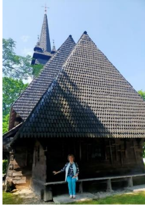
Фото. Церква Святого Миколая Чудотворця – дерев’яна церква, розташована в селі Сокирниця, пам’ятка архітектури національного значення (№ 227). Цей храм один із найдавніших на території Закарпаття 18