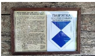
Фото. Меморіальна пам'ятка на якій написана історія «мандрівної церкви» з села Шелестова

Шелестівська Михайлівська церква – пам'ятка архітектури національного значення. Часто вживаною є інша назва будівлі – церква Святого Архистратига Михаїла. Ця пам'ятка – одна з небагатьох дерев'яних церковних споруд в Україні, яка збережена до ХХІ століття. Наразі церква є одним із експонатів музею, який розташовується під відкритим небом «Закарпатський обласний музей народної архітектури та побуту».