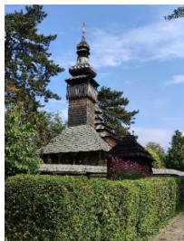
Фото. У 1927 році (за іншою версією – у 1928-му) відбулася перша мандрівка Шелестівської церкви у Мукачево.