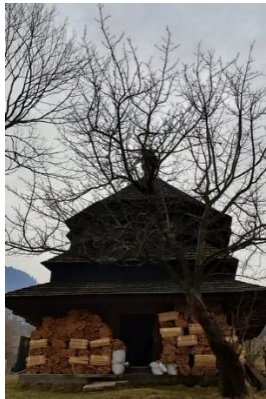
Фото. 11-метрова смерекова дзвіниця 1811-1813 років.