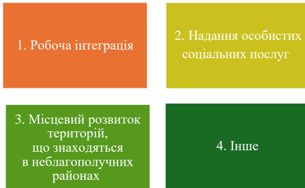
Рис. 1. Чотири основні сфери соціального підприємництва

Перша сфера – це навчання та інтеграція людей з обмеженими можливостями та безробітних; друга сфера – надання особистих соціальних послуг, зосереджене навколо вирішення проблем, пов'язаних із здоров'ям, добробутом, медичною допомогою та послугами, професійним навчанням, освітою, доглядом за дітьми, допомогою особам похилого віку та малозабезпеченим.