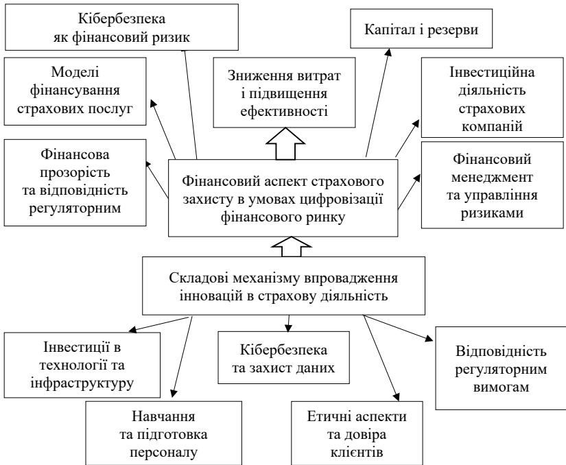
Рис. 2. Складові механізму впровадження інновацій в страхову діяльність

Враховуючи фінансові та технологічні аспекти розглянемо більш детально складові механізму впровадження інновацій в страхову діяльність на рисунку 2.