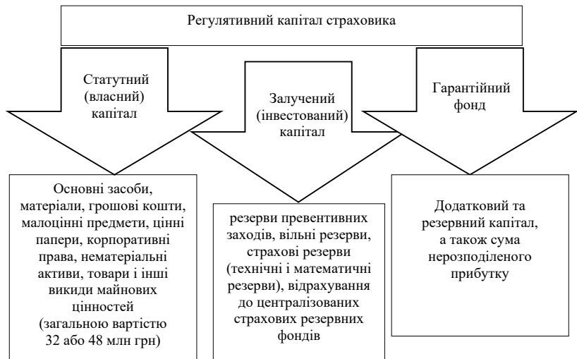
Рис. 3. Структура капіталу страхової компанії

Важливою складовою розробки механізму інвестиційної активності страховиків є забезпечення їх фінансової стійкості. Тому серед сучасних інвестиційних методологій управління резервами і капіталом страхових компаній, як пріоритетного напрямку страхової діяльності постає завдання досягнення необхідного рівня їх фінансової безпеки в ринковій економіці, який спрямований на створення ефективної системи формування страхових фондів направлених на своєчасну компенсацію збитків страхувальникам [1]. З огляду на законодавчі вимоги до формування капіталу страхових організацій відокремимо його складові на рисунку 3.