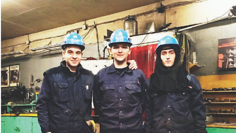
Рисунок 5 – Здобувачі освіти на робочих місцях під час проходження технологічної практики

Згідно відгуків “BLRT GRUPP” практиканти проявили себе як ініціативні, працьовиті та кваліфіковані робітники, які спроможні вирішувати поставлені виробничі задачі. Здобувачам освіти довіряли виготовлення досить відповідальних конструкцій.