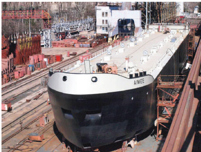
Рисунок 2 – Стапель ТОВ “Смарт-Мері тайм Груп” Херсонська верф, корпус танкеру, в побудові якого приймали участь здобувачі освіти 4-го курсу спеціальності 135 “Суднобудування” під час проходження технологічної практики.

Роботодавці, нарешті, зрозуміли, що вчорашній здобувач освіти може бути повноцінним фахівцем, якщо вкладати кошти в освіту.