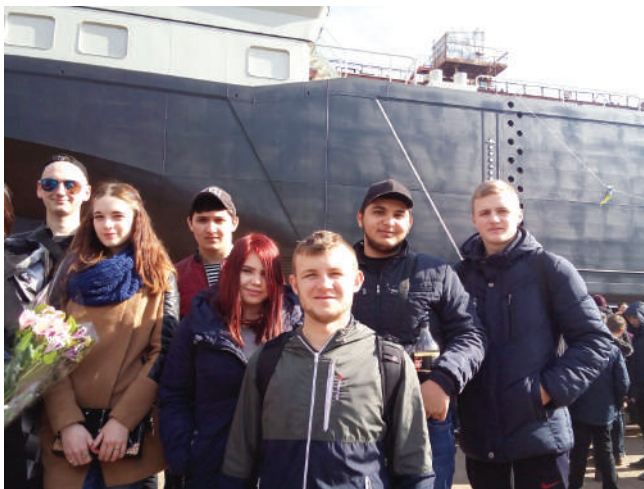
Рисунок 1 – Здобувачі освіти 2-го курсу спеціальності 135 “Суднобудування” на стапелі ТОВ “Смарт-Мері тайм Груп” Херсонська верфь приймають участь у відкритому заході “Спуск судна”

• проведення спільних заходів на базі закладу освіти: круглих столів, майстер-класів, тренінгів, практичних конференцій, ярмарків вакансій, днів кар'єри тощо.