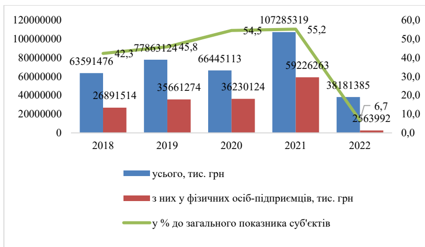
Рис. 3. Обсяг реалізованих послуг закладами тимчасового розміщування та харчування в Україні протягом 2018–2022 рр.

регіонах падіння становить понад 50% (Харківська, Миколаївська, Запорізька та Луганська області); у Київській, Одеській та Дніпропетровській областях падіння становить до 30%. На початку літа падіння ринку було ще більш відчутним. Однак у Києві ресторани почали відкриватися в червні (Кобинець, 2022). Найбільш інтенсивно ресторанний ринок розвивався у Львові: з початку війни відкрито понад 500 нових ресторанів.