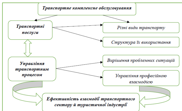
Рис. 2. Складові транспортного комплексного обслуговування (розробка авторів)

На думку вчених, майбутні фахівці з туризму повинні не лише володіти туристичними технологіями, але й мати сформовані компетентності управлінського характеру. Мова йде про «уміння організувати ефективну командну роботу та керувати працівниками, використовуючи сучасні методи управління [1, с. 8].