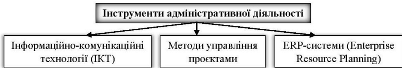
Рис. 2. Сучасні інструменти адміністративної діяльності

Сучасна адміністративна діяльність базується на застосуванні інноваційних інструментів, які сприяють підвищенню ефективності управлінських процесів, зниженню витрат, підвищенню продуктивності та забезпеченню адаптації підприємства до швидких змін у зовнішньому середовищі. Основні інструментами які використовуються в сучасній адміністративній діяльності відображено на рис. 2.