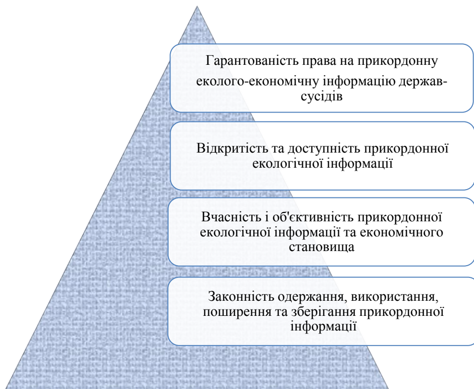
Рис. 3. Принципи транскордонної еколого-економічної інформації