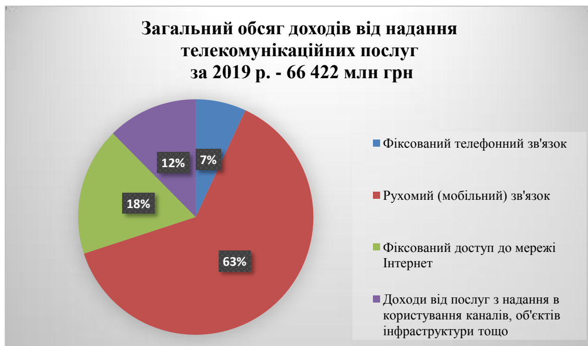
Рис. 1.2. Структура доходів від надання телекомунікаційних послуг за 2019 р., млн грн

– стала тенденція останніх років щодо наявності щорічної значної кількості випадків пошкодження телекомунікаційних мереж операторів телекомунікацій шляхом викрадення мідних кабелів та телекомунікаційного обладнання.