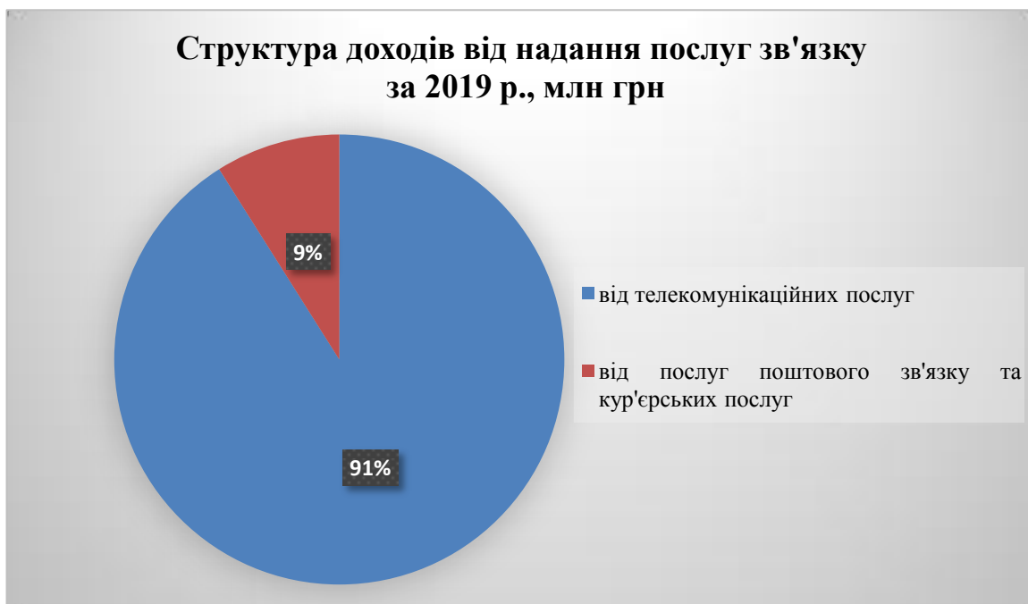
Рис. 1.1. Структура доходів від надання послуг зв'язку України за 2019 р., млн грн

У 2019 р. доходи від надання послуг зв'язку України становили 72 961 млн грн, у них частка доходів від надання телекомунікаційних послуг – 91,0%, а від надання послуг поштового зв'язку та кур'єрських послуг – 9,0% (рис. 1.1).