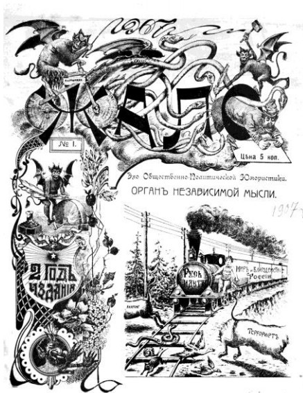
Рис. 3. «Настоящее жало». Обкладинка. 1907 р. № 1

Цікавими прикладами дизайну є ювілейні обкладинки «Настоящего жала». Основна типографіка лишилась без змін, лише були прибрані зміст та вихідні дані. Головною новинкою було декоративне обрамлення зверху та з лівого боку обкладинки. Воно включало ілюстрації демонів та чортів на велосипедах, вплетених змій, рослин, орнаментів тощо. Дотепною деталлю цієї ілюстрації є хлист у одного з чортів, що зображає рік видання. Увесь цей модерністський декор оточує логотип журналу. З правого боку знизу знаходиться головна карикатура (рис. 3).