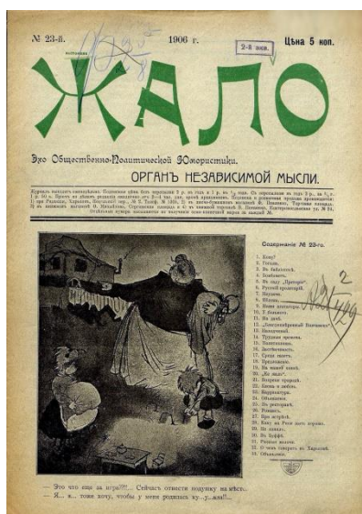
Рис. 2. «Настоящее жало». Обкладинка. 1906 р. № 23

Цікавими прикладами дизайну є ювілейні обкладинки «Настоящего жала». Основна типографіка лишилась без змін, лише були прибрані зміст та вихідні дані. Головною новинкою було декоративне обрамлення зверху та з лівого боку обкладинки. Воно включало ілюстрації демонів та чортів на велосипедах, вплетених змій, рослин, орнаментів тощо. Дотепною деталлю цієї ілюстрації є хлист у одного з чортів, що зображає рік видання. Увесь цей модерністський декор оточує логотип журналу. З правого боку знизу знаходиться головна карикатура (рис. 3).