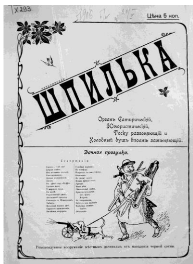
Рис. 1. «Харьковская шпилька». Обкладинка. 1906 р.

юмористический, тоску разгоняющий и холодный душ вполне заменяющий». Також на обкладинці стандартно розміщувалася основна карикатура (рис. 1).