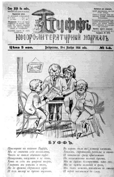
Рис. 4. «Буфф». Обкладинка. 1907 р. № 1

Хоча «Буфф» та «Брызги» перестали виходити у світ після перших номерів без втручання влади, але після цих проєктів починається поживлення сатиричної періодики Харкова завдяки вищезгаданому А. Аверченко.