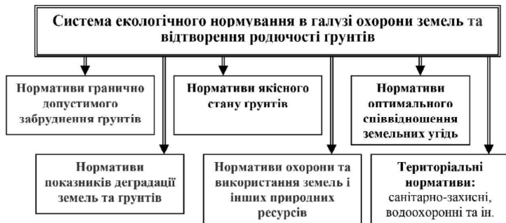
Рис. 2. Логічно-змістовна схема системи земельно-екологічних нормативів у галузі землекористування