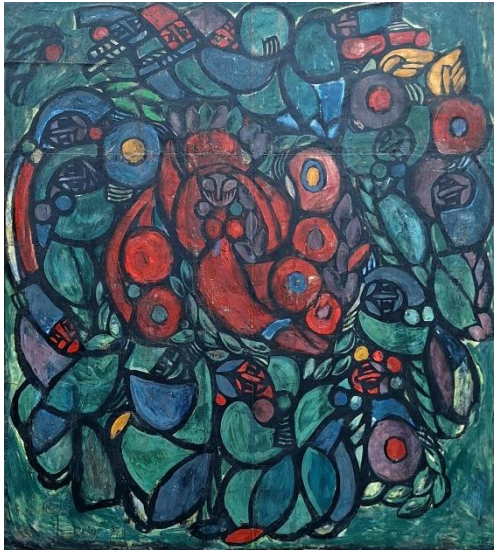
Іл. 2. Стороженко М. А. Ескіз вітража «Наречена». 1971 р. Папір, дерев'яна основа, темпера, гуаш, лак. 150x136,5 см

Другий ескіз, «Наречена» ( Праматір? ) (іл. 2), протилежний за емоційним навантаженням, виглядає антитезою першому. Виконаний у холодній зеленкуватій колірній гамі, він асоціюється з природним оновленням, весняною травою, деревами, символічно – із Деревом Життя. Його густе листя створює атмосферу спокою. У центрі композиції – Жінка (наречена, засновниця роду, Праматір), навколо якої ведуть танок-хоровод хлопці та дівчата. За формою, композиційно, їхнє розташування нагадує вінок. Зображення музик із традиційними українськими інструментами – сопілкою, бубнами, скрипкою – підкреслює мелодику твору.