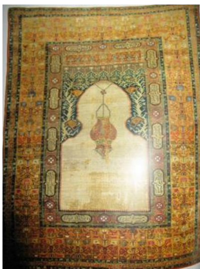
Килим Хереке з каталогу