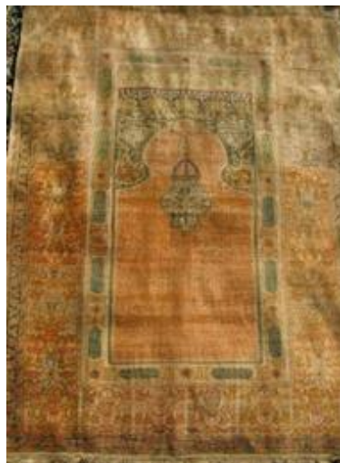
Килим № Тк-192