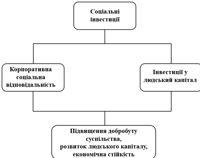
Рис. 2. Модель взаємодії соціальних інвестицій та розвитку людського капіталу в корпоративному контексті

дослідники приділяють значну увагу ролі людського капіталу як одного з ключових чинників економічного розвитку.