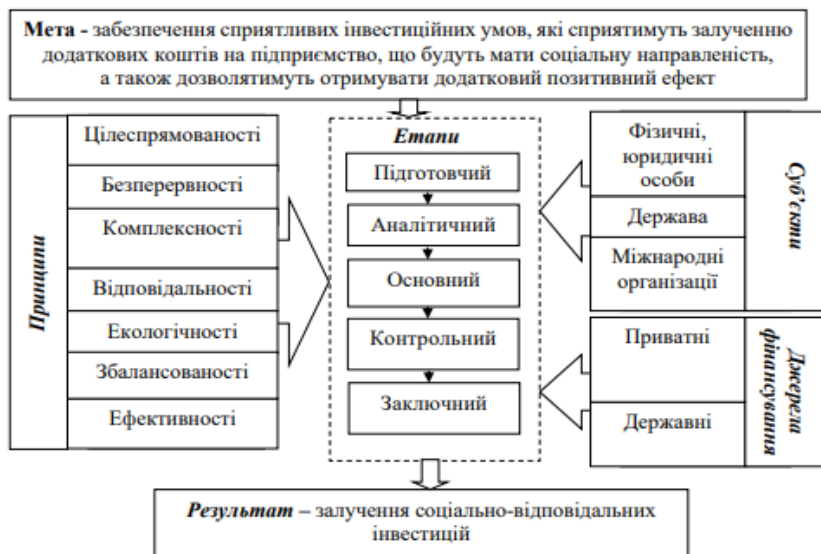
Рис. 5. Складові елементи механізму соціально-відповідального інвестування підприємства 21

Подальший розвиток концепції соціального інвестування в Україні доцільно розглядати крізь призму його впливу на структурні зрушення в економіці та підвищення її конкурентоспроможності. Соціальні інвестиції виступають не лише інструментом покращення добробуту населення, а й важливим чинником формування якісно нового економічного середовища, орієнтованого на інноваційний розвиток та стійке зростання.