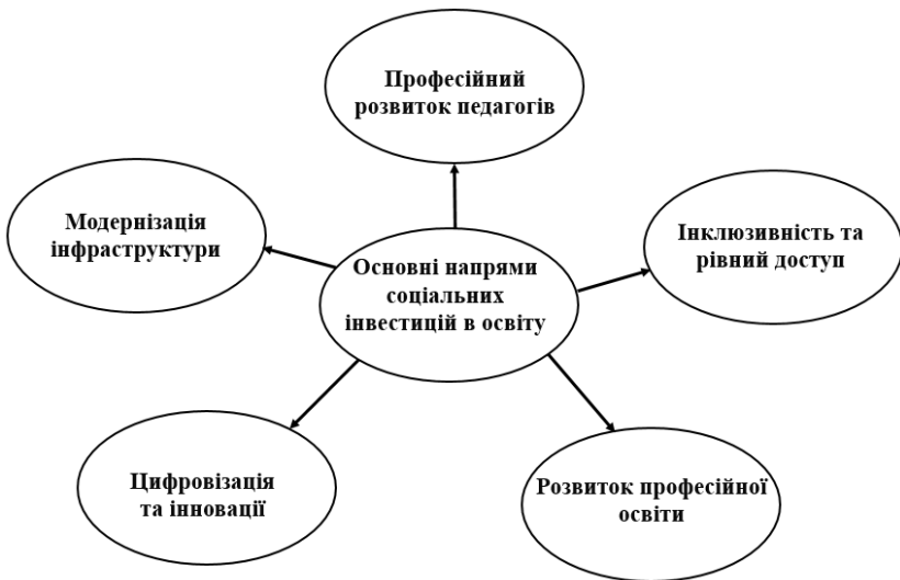
Рис. 4. Основні напрями соціальних інвестицій в освіту

педагогів, то у цьому контексті маються на увазі інвестиції у навчання вчителів, підвищення їх кваліфікації, підтримка та мотивація освітнього персоналу. Інклюзивність та рівний доступ передбачає проекти для дітей з особливими потребами, гранти для здобувачів з вразливих груп населення. Також важливим напрямом є розвиток професійної освіти, що об'єднує співпрацю з бізнесом для адаптації навчальних програм до потреб ринку праці, створення навчально-практичних центрів.