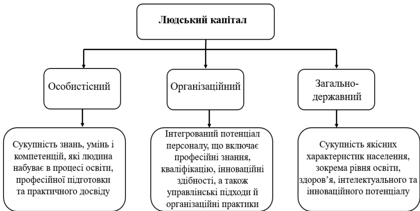
Рис. 3. Рівні людського капіталу

Соціальне інвестування також можна розглядати як гнучкий механізм управління ризиками, який сприяє зменшенню вразливості економіки до кризових явищ. Його реалізація забезпечує розвиток соціального капіталу та формування стійких взаємозв'язків між державними структурами, бізнесом і суспільством.