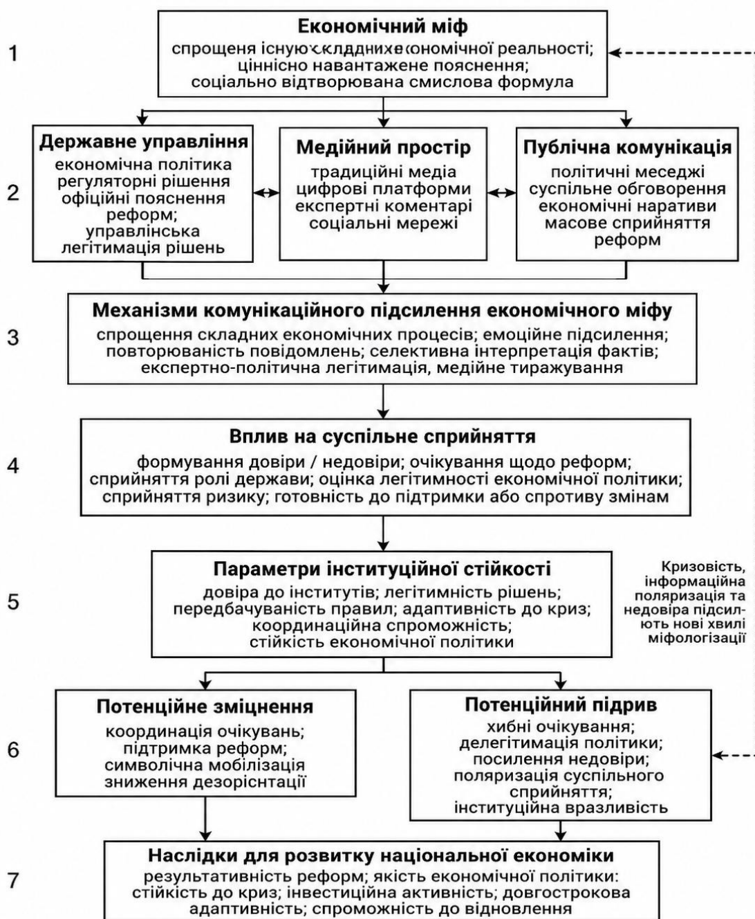
Рис. 3. Економічні міфи у державному управлінні, медійному просторі та публічній комунікації: канали поширення та впливу на інституційну стійкість

складної комунікаційної взаємодії між державними інститутами, медіа та суспільством. Саме через ці канали він може впливати на довіру до інститутів, підтримку реформ, сприйняття легітимності економічної політики та загальну адаптивність економічної системи до змін.