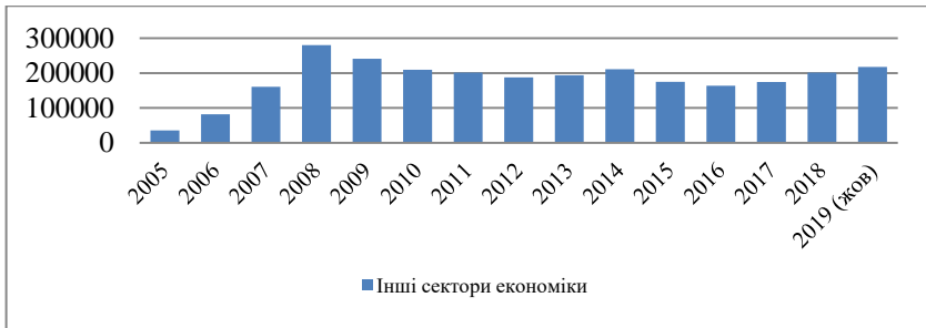
Рис. 2. Динаміка кредитів, наданих іншим секторам економіки, млн. грн.

Наступним суб'єктом за величиною в загальному обсязі кредитування, за якими НБУ оприлюднює статистичні дані є група суб'єктів під назвою «інші сектори економіки». У цей сектор включені домогосподарства та некомерційні організації, що їх обслуговують. Розглянемо більш детально динаміку кредитів наданих цим суб'єктам за допомогою рис. 2.