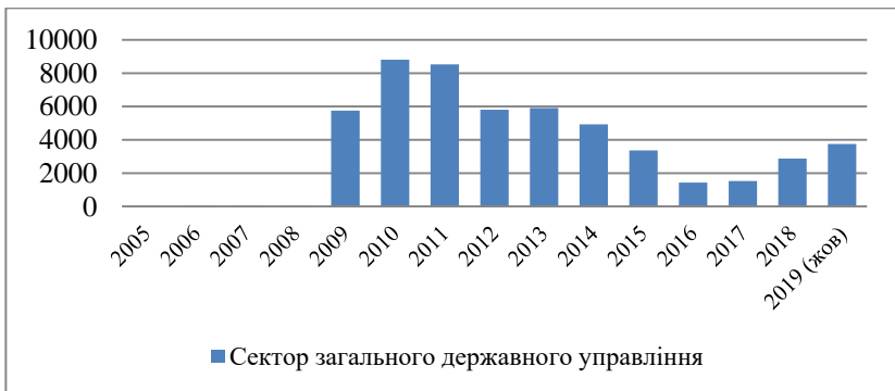
Рис. 4. Динаміка кредитів сектору державного управління, млн. грн.

Найменша частка серед споживачів кредитних послуг припадає на сектор загального державного управління (див. рис. 4). Як бачимо, різкий ріст кредитування спостерігається у 2009 році, що у абсолютному значенні склало 5743,48 млн. грн. порівняно із 2008 роком. І починаючи із 2010 року прослідковується стійка негативна тенденція до 2016 року, яка змінилася у 2017 році, після чого ринок, хоч і незначно, проте зростає.