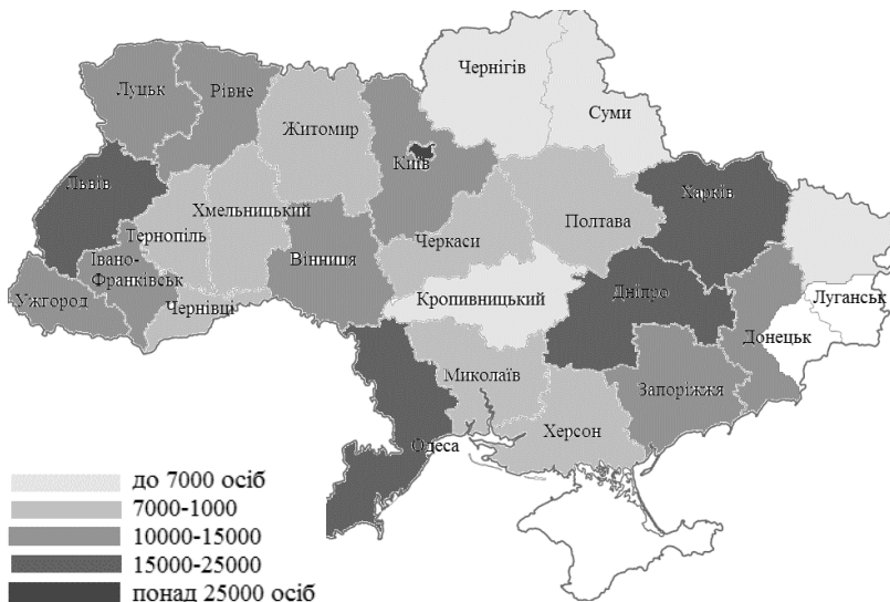
Рис. 3. Розподіл кількості народжених по областях України за 2019 р.

На основі даних Державної служби статистики про кількість народжених розглянемо структуру народжених в Україні за 2019 р. за регіонами, таким чином, щоб виявити області з найбільшим потенціальним трудовим ресурсом (рис. 3).