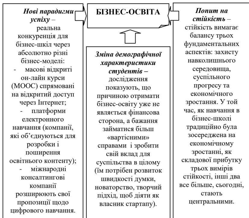
Рис. 2. Вплив нових викликів часу для бізнес-освіти

наукові ступені, проте сертифікат про закінчення курсів від авторитетної консалтингової компанії, такої як McKinsey або PwC можна вважати на рівні престижним.